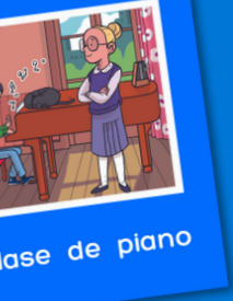
Clase de piano

Click on a title to see its lesson plan.